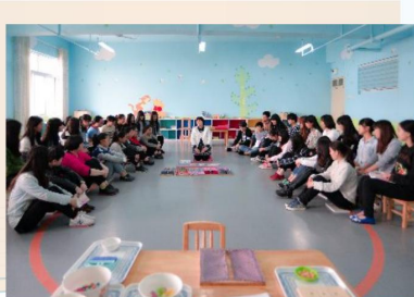
蒙台梭利课实训室