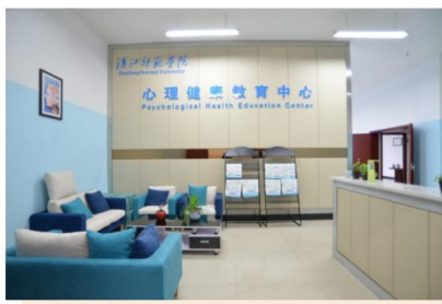
心理健康教育中心