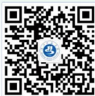
汉江师范学院 官方微信公众号