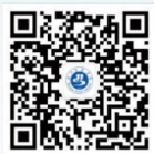
汉江师范学院 招生办微信公众号