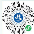
汉江师范学院 招生就业智慧平台