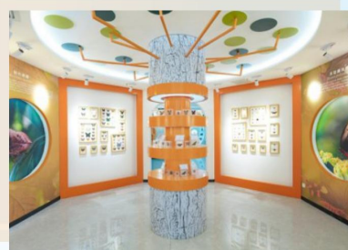
生物博物馆（湖北省科普基地）